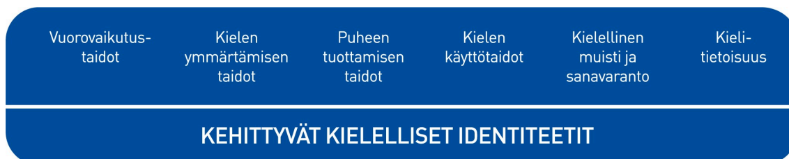
Kuvio 2. Lasten kielen kehityksen keskeiset osa-alueet varhaiskasvatuksessa

Kielen oppimisen kannalta on tärkeää tiedostaa, että saman ikäiset lapset voivat olla eri vaiheissa kielen kehityksen eri osa-alueilla. Kielelliset identiteetit kehittyvät , kun lapsia ohjataan ja tuetaan kielellisten taitojen ja valmiuksien keskeisillä osa-alueilla.